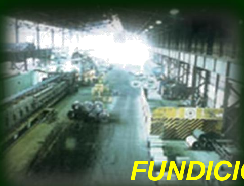
FUNDICION DE METALES

Todo residuo industrial, de acuerdo a la ley general de residuos, tiene que ser llevado a una planta de tratamiento de acuerdo a la naturaleza del residuo, donde se le realizara su disposición final. En el caso del residuo peligroso que no se le pueda dar un tratamiento adecuado, tendrá que ser internado en un relleno de seguridad autorizado por la autoridad competente.