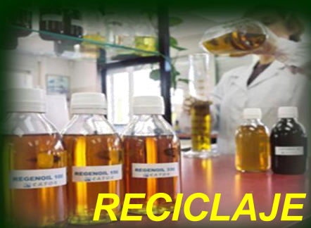
RECICLAJE DE ACEITES USADOS