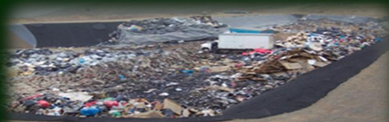
RELLENO DE SEGURIDAD